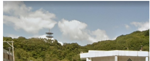
浦河ターミナル (コープ併設)