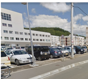
東町 (様似から到着)